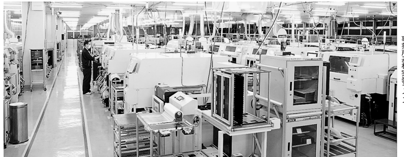
アドバンテック株式会社直方事業所基板実装ライン

また、監査の「統計的品質管理」という項目では、品質データを共有しながら議論を行い自社の品質がグローバルでも十分通用するということ分かり、自信になったのが気づきです。通常他社比較はできません。このようにインプットもいただけるのは非常にプラスになりましたし、自分たちの現在地が見える化できたことは非常に重要です。監査を通じて、過去に作った仕組みが形骸化せずに運用されているかを、しっかり見直す良い機会にもなりました。