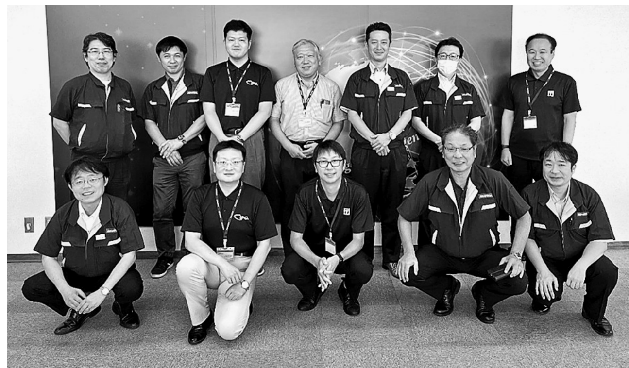
IPC監査認証取得の中心メンバー