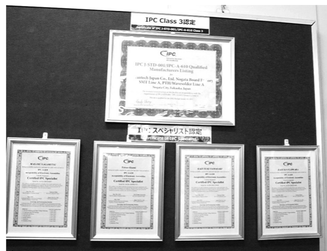
事業所内に掲げられた認定証

開には時間がかかります。認証取得の検討を進める中で、エレクトロニクス市場における日々の進化に迅速に対応するためには、IPCが最適な規格であるとの確信が生まれました。そして、この第1号認証を取得することが、私たちのものづくりが国内の実装業界をリードしていくことにつながると考えたのです。