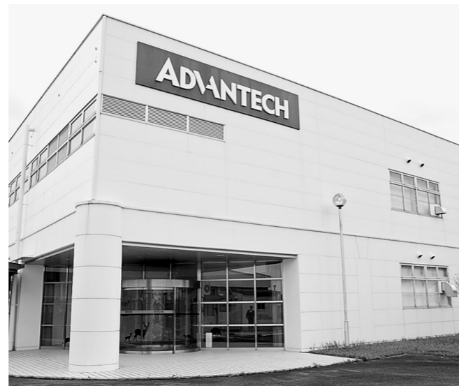
アドバンテック株式会社直方事業所

また、IPC工場認定を受けた「ものづくり力」が会社の強みです。品質と信頼性において圧倒的な実績を誇り、これからもお客さまや社会に貢献していくことが私たちの目指す姿です。